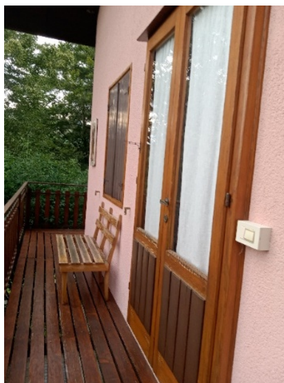
Fig. 3. La panchina sul balcone

di me, primo fra tutto Primo Levi, e a tutti i pensieri e i discorsi sentiti da quelle pareti. 27