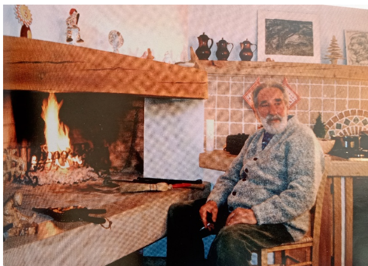
Fig. 4. Rigoni Stern davanti al grande camino nel 2003

Tra gli oggetti più amati, c'è la storica Lettera 22, la macchina da scrivere che Olivetti gli regala dopo la vittoria al premio Viareggio per Il sergente nella neve (1953). E' il suo primo libro e quello che gli conferisce la fama a livello nazionale. Rigoni gli aveva chiesto lo sconto per comprarsi una macchina da scrivere, ma Adriano Olivetti gliela manda in regalo. 33 Con quella scrisse i suoi numerosi racconti e romanzi che si dividono tra temi di guerra e di Altopiano.