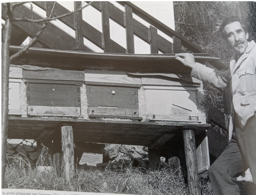
Fig. 6. Rigoni e le sue arnie

Ancora più in là, c'è lo spazio per il canile che Mario menziona in Uomini boschi e api e che diventa l'ambiente per un piccolo miracolo naturale. Riguarda una passera che doveva emigrare con il suo stormo, ma che si attarda e si fa sorprendere dall'inverno. Una notte Mario sorprende il suo cane, Cimbro, in un atto di solidarietà animale: «da sotto le ciglia innevate potei vedere che lui, tra le zampe e il letto, si teneva al caldo la passera scopaiola». 39