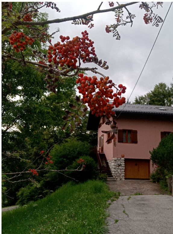
Fig. 2. Il sorbo sul vialetto